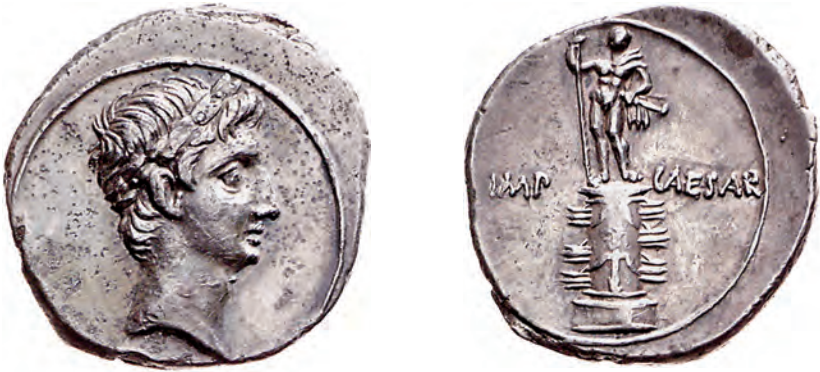
11 Denar des C. Caesar (Octavianus). Links Kopf des Octavian mit Lorbeerkranz. Rechts Ehrenstatue Octavians in heroischer Pose mit Lanze und Schwert auf einer columna rostrata , wie sie auf dem Forum Romanum aufgestellt war, um 31/29 v. Chr. Silber, Staatliche Museen zu Berlin, Münzkabinett

agierte geschickt. Es gelang ihm, die gerade übergelaufenen Truppen an sich zu binden, worauf Lepidus aufgeben musste und sich ins Privatleben, in eine Art Hausarrest zurückziehen musste. Allein die Stellung als Oberpriester – pontifex maximus – blieb ihm bis 12 v. Chr. erhalten.