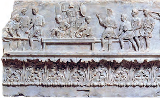
13 Marmorrelief vom Apollontempel des C. Sosius. Es zeigt Szenen vom dreifachen Triumph des Imperator Caesar nach Actium. Konservatorenpalast, Rom

schen System und allein gestützt auf Soldaten nicht denkbar war. Rom war nur zu kontrollieren, wenn es ihm gelingen sollte, eine breite Masse der stadtrömischen Bevölkerung wie der ritterlichen und senatorischen Führungsschichten zu gewinnen. Dass dies Repressalien, nackte Drohungen und Exekutionen nicht ausschloss, war kein Widerspruch. Nach tausenden von Toten, die man in den Bürgerkriegen, in Folge der Proskriptionen und der Alltagsgewalt auf den Straßen zu beklagen hatte, gaben sich die Zeitgenossen diesbezüglich keinen Illusionen hin, zumal der Imperator Caesar im Ruf stand, ein blutiger Schlächter zu sein. Nun galt es, die befleckte Toga schnell zu reinigen und das weiße Gewand des vorbildlichen Römers anzulegen, wollte man einen tragfähigen Frieden erreichen. Doch wie sollte das in einer Gesellschaft bewerkstelligt werden, die noch damit beschäftigt war, ihre Toten zu beklagen? Die Römer verfügten angesichts des Chaos, das in den letzten Jahrzehnten die Politik bestimmt hatte, über keinerlei Vorstellung, wie ein Neubeginn gemeinsam gestaltet werden konnte.