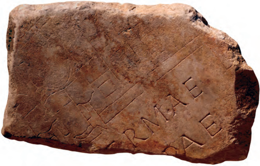
12 Marmorfragment des monumentalen severischen Stadtplan Roms ( Forma Urbis Romae ), auf dem Bauten des Agrippa auf dem Marsfeld eingraviert sind. Ein Rest der Beischrift « Thermae Agrippae » ist erhalten. Museo della Civiltà Romana, Rom

Da Antonius nach Ansicht des Senats gänzlich von Kleopatra beherrscht wurde und willenlos war, erklärte man ihr den Krieg. Es sollte ein Krieg gegen eine auswärtige Macht, nicht gegen römische Bürger sein, auch wenn der Großteil der Truppen des Antonius römische Legionäre waren. Mit militärischem Druck von Soldaten wie angesiedelten Veteranen gelang es Imperator Caesar, ganz Rom und die italische Halbinsel eidlich auf sich zu verpflichten. Immerhin mussten die Italiker ein Viertel ihres Jahreseinkommens für die Finanzierung des Krieges abliefern. In seinem Tatenbericht sprach er später vom consensus universorum (der Übereinstimmung aller), der ihn zum Führer ( dux ) gegen die Feinde gemacht habe. Mit diesem propagandistisch unterfütterten Euphemismus gab er in der Tat recht treffend wieder, dass er nicht allein im Hinblick auf die bevorstehenden Kämpfe, sondern insbesondere mit Blick auf seine politischen Pläne eine möglichst breite Unterstützung benötigte. Der klugen Taktik Agrippas war es schließlich zu verdanken, dass seine Partei weiter gestärkt wurde. Dazu gehörte Agrippas umsichtige Baupolitik in Rom, die ihm in einer Mischung aus Infrastrukturmaßnahmen und Prachtbauten auf dem Marsfeld den Zuspruch der stadtrömischen Bevölkerung sicherte (Abb. 12).